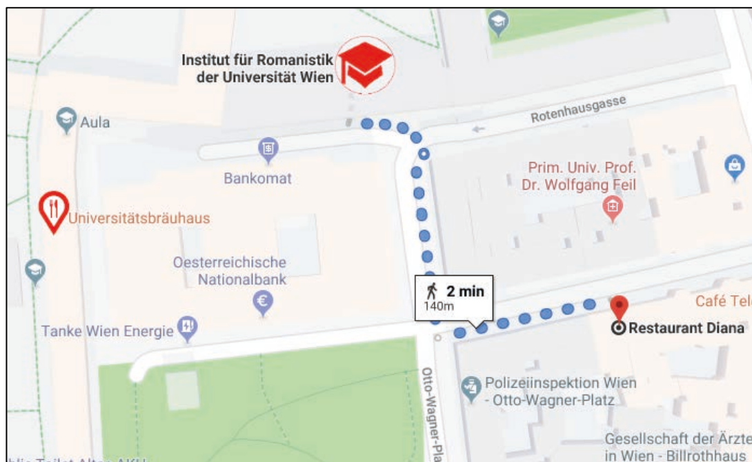
5. Wegbeschreibung: Tagungsort (ROM14) - Restaurant Diana