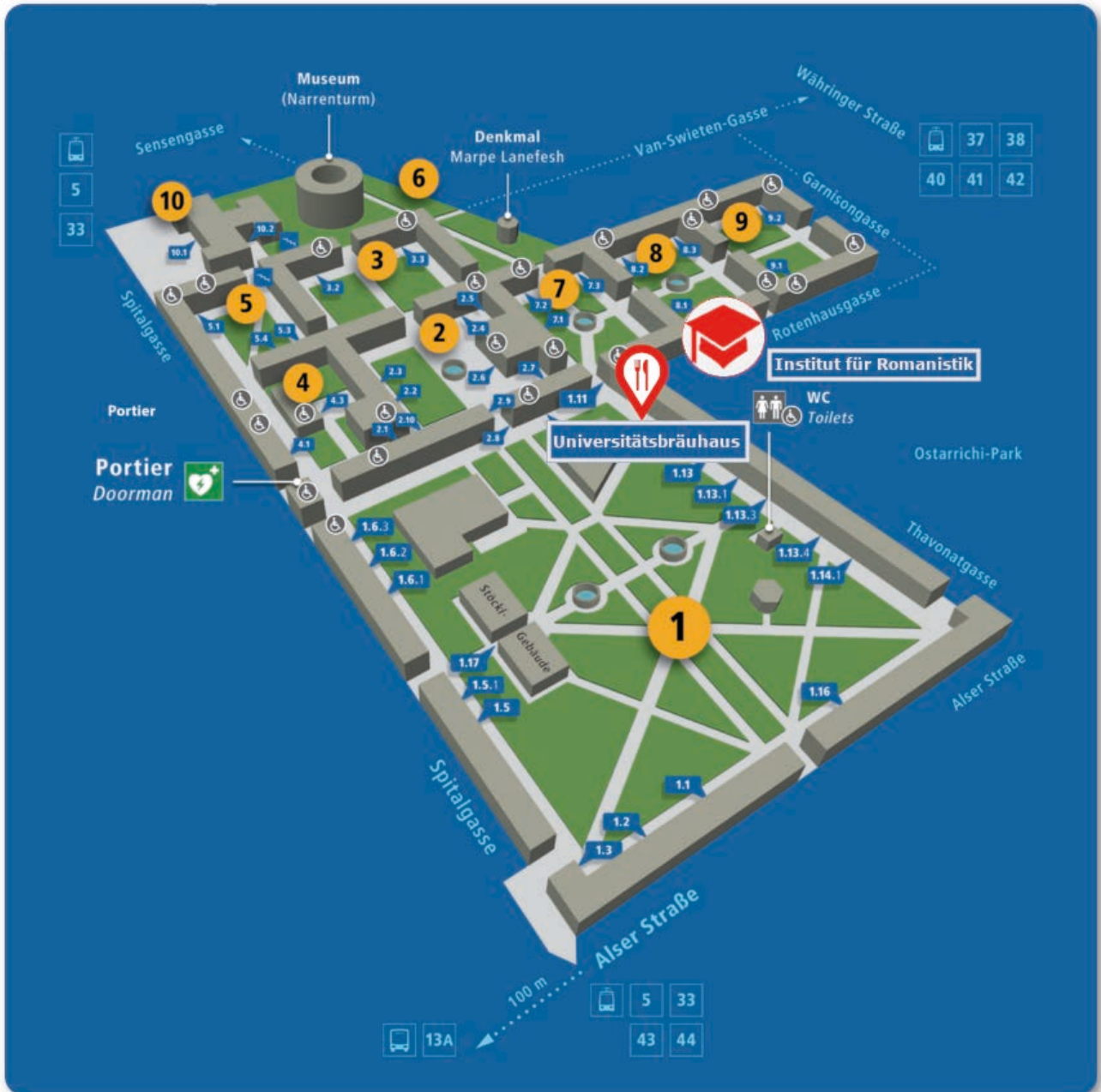
1. Universitätscampus mit Tagungsort (ROM14) und Restaurant Universitätsbräuhaus