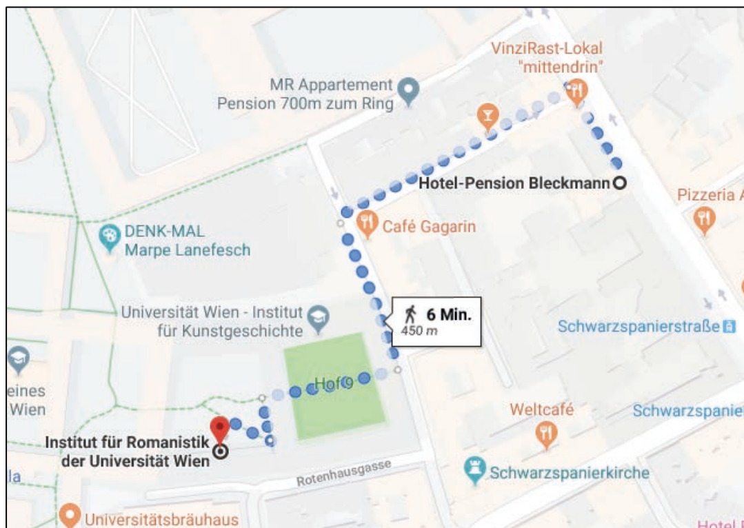
4. Wegbeschreibung: Hotel Bleckmann – Tagungsort (ROM14)